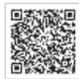
経営健全化計画の完了について (大町病院 HP)

大町市病院事業会計は、平成29年度決算における資金不足比率が地方公共団体の財政の健全化に関する法律に規定する経営健全化基準の20%を超えたため、経営健全化計画を策定し、早期の健全化に向けた取組みを行ってまいりました。令和3年度をもって本計画が完了しましたので、これまでの実施状況の概略を報告します。なお、詳しくは当院ホームページをご覧ください。